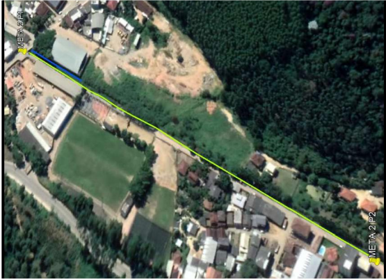
LOCAÇÃO META 1

P1 318034.00 m E ; 7787289.00 m S P2 317828.00 m E ; 7786866.00 m S